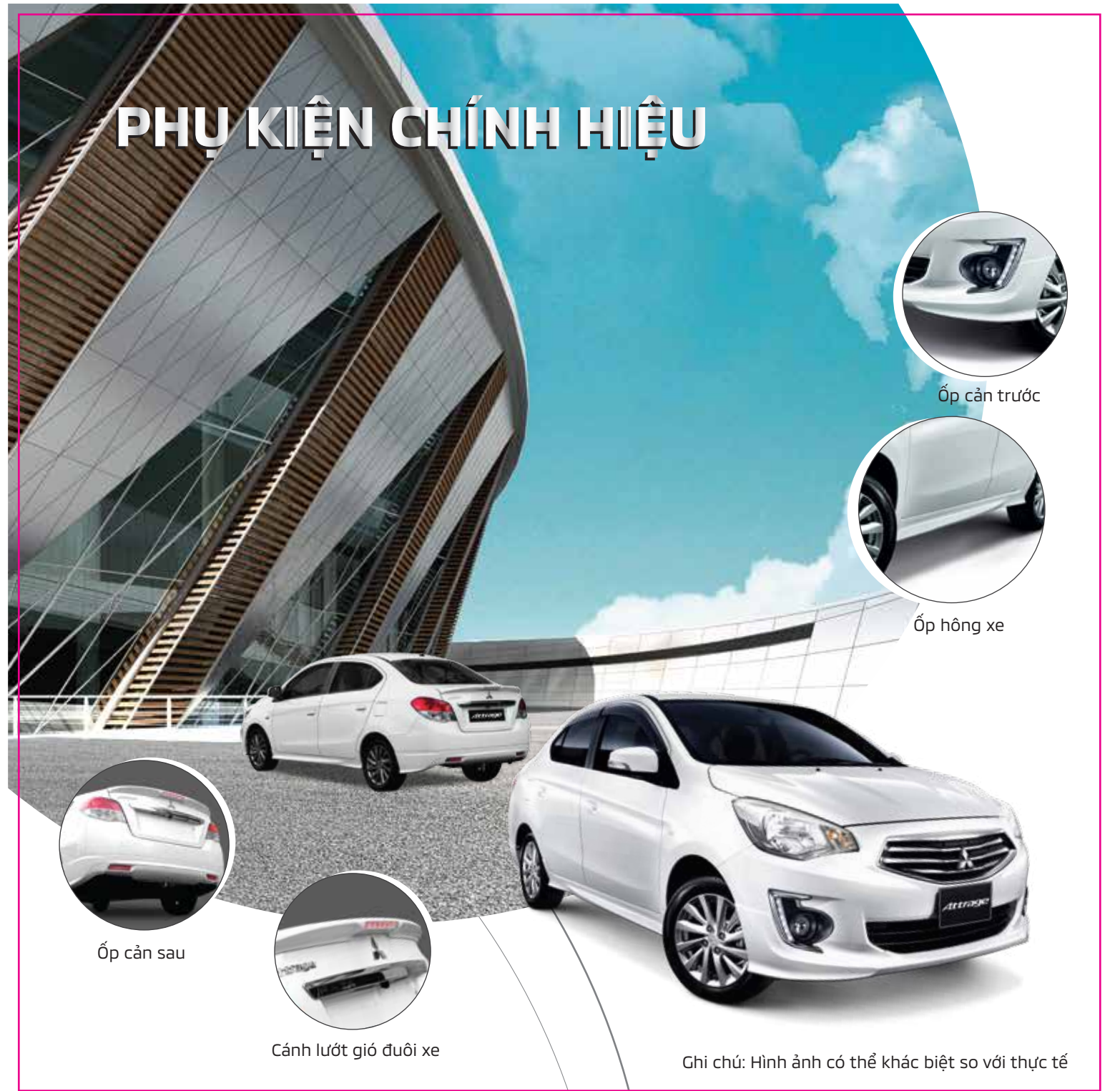
Ốp cản sau