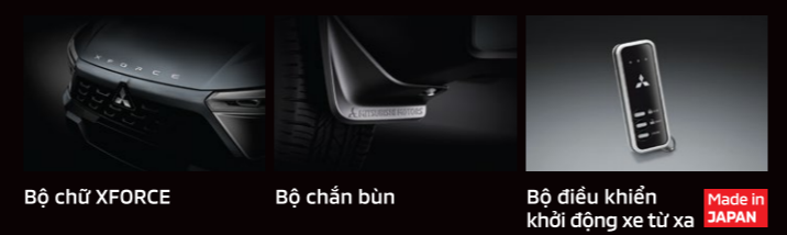
Bộ chủ XFORCE Bộ chắn bùn Bộ điều khiển khởi động xe từ xa

Ghi chú / Note: Thông số kỹ thuật & trang thiết bị có thể thay đổi từ nhà sản xuất mà không báo trước. Some specifications and equipment could be changed without prior notice.