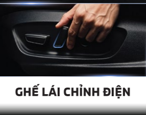
GHẾ LÁI CHỈNH ĐIỆN