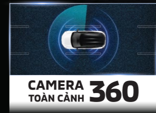
CAMERA TOÀN CẢNH 360