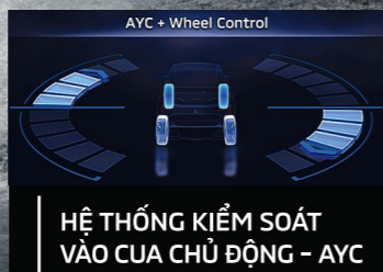
HỆ THỐNG KIỂM SOÁT VÀO CUA CHỦ ĐỘNG - AYC