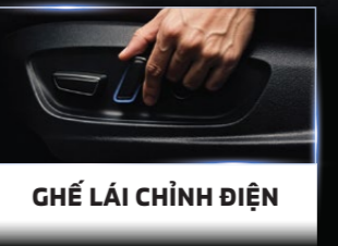
GHẾ LÁI CHỈNH ĐIỆN